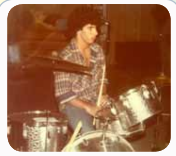
נחשו מי זה?