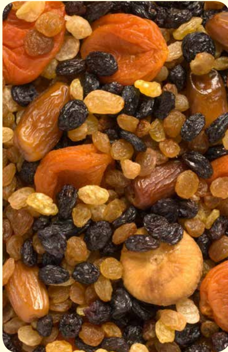
מקווה שנהנתם חג שמח